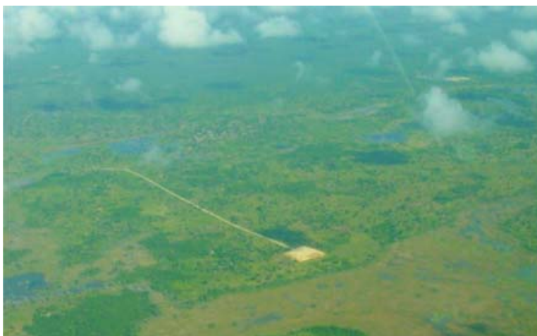
HUMEDAL Y RIO GOVURO. POZO OCHO, CAMPO TEMANE

El proyecto se ubica en la costa Sur de Mozambique. Está atravesada por el Río Govuro, con una cuenca de 11.200 Km 2 , que fluye paralelo a la costa de Norte a Sur del bloque Temane para terminar en un humedal asociado al río Govuro.