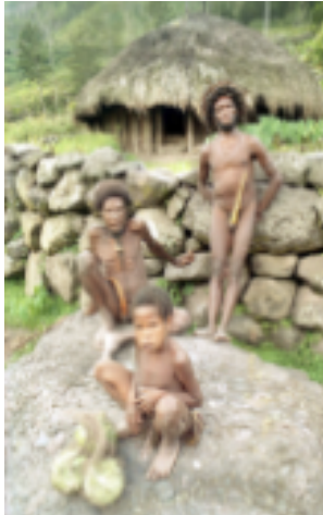
Ilustración 6: La población local

Desde los años 1960, la población Amungme, de la zona de Lorentz, ha visto cambios muy rápidos en sus tierras y en sus vidas debido a la iniciación de una operación minera masiva en sus tierras, que comenzaron trabajos en 1972. Rara vez utilizan las tierras de las regiones altas alpinas (sobre los 4,000 m) pues esta área es considerada sagrada. Las áreas montañosas altas (3,000 – 4,000 m) son utilizadas principalmente para cacería y acopio. Las aldeas de los Amungme generalmente están ubicadas entre los 1,000 m y los 2,000 m sobre el nivel del mar, aunque actualmente también viven, cazan y/o acopian a elevaciones menores, en los bosques de las tierras bajas o en las praderas (0 – 100 m).