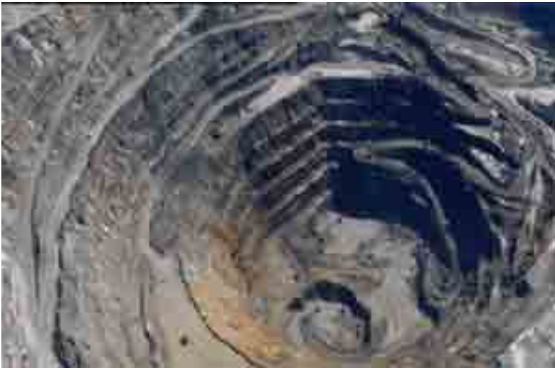
Ilustración 8: Operaciones Mineras en el Parque Nacional Lorentz

Finalmente, el gobierno provincial, en colaboración con Freeport Indonesia, han desarrollado un plan espacial que dirige todo el desarrollo fuera del Parque y crea una zona de amortiguamiento más amplia a lo largo del límite occidental del parque.