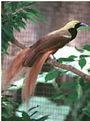
Ilustración 4: Ave del Paraíso

Por lo menos 10 especies que habitan en la zona son especies animales que se encuentran en estado de amenaza a nivel mundial, como el Casuario de Ceram ( Casuarius casuarius ), la Gura Sureña ( Goura scheepmakeri ) y el Loro Aguilero ( Psitttrichas fulgidus ) se viven en las tierras bajas. Entre las aves en peligro y que se encuentran en estado vulnerable, dentro de la zona montañosa, tenemos al Ánade Papúa ( Anas waigiensis ), el Tordo Australiano Roquero ( Petroica archboldi ) y el Ave del Paraíso de MacGregor ( Macgregoria pulchra ).