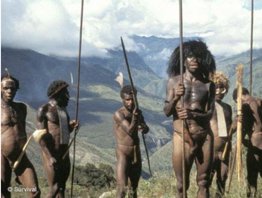
Ilustración 5: La población local

Existen aproximadamente 11,000 habitantes dentro del parque, todos ellos miembros de diversas tribus.