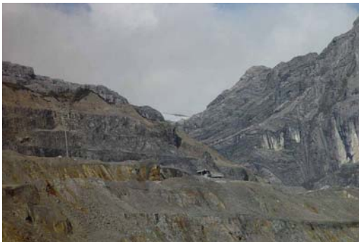
Ilustración 7: Glaciar en el Parque Nacional Lorentz

En contraste, el Proyecto de Conservación del Parque Nacional Lorentz comprende una iniciativa comunitaria para la conservación de patrimonios comunales y ecológicos en zonas aledañas al Parque Nacional Lorentz.