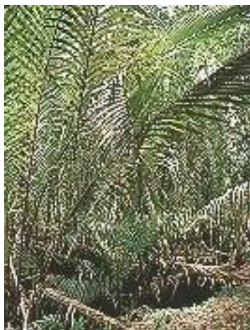
Ilustración 3: Bosque Nypa

La zona montañosa alta comprende el Sistema de Tierras Kemum, que consiste de laderas de cerros empinadas y profundamente seccionadas. Esta zona de altura está sub-dividida en la Sub-Zona Montañosa Baja, la Sub-Zona Montañosa Intermedia, y la Sub-Zona Montañosa Alta. La Sub-Zona Montañosa Baja (600-1500 m) incluye las colinas al pie de las montañas y las pendientes bajas de los montes. El bosque es muy diferente a las zonas que lo circundan, diferenciándose de los bosques aluviales por su menor altura y por ser más cerrados. Estos bosques forman las zonas de Nueva Guinea más ricas en flora y contienen más de 80 géneros y 1200 especies de árboles. Los tipos de vegetación de la Sub-Zona Montañosa Intermedia incluyen bosques mixtos de zonas montañosas intermedias, bosques Castanopsis , bosques Nothofagus , bosques coníferos, bosques pantanosos de zonas montañosas intermedias, pantanos de juncia de zonas montañosas intermedias, pantanos de pastos Phragmites , prados Miscanthus y una sucesión de jardines abandonados. Los bosques de las montañas intermedias son conocidos como bosque de nubes o bosque musgoso.